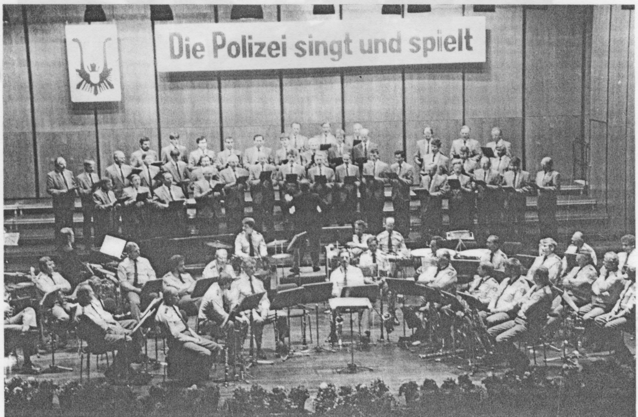
Wohltätigkeitskonzert am 19.5.1989

„Der Chor bezweckt die Pflege des Chorgesanges. Zur Erreichung dieses Zieles hält der Chor regelmäßig Chorproben ab, veranstaltet Konzerte und stellt sich mit seinem Singen in den Dienst der Öffentlichkeit.“